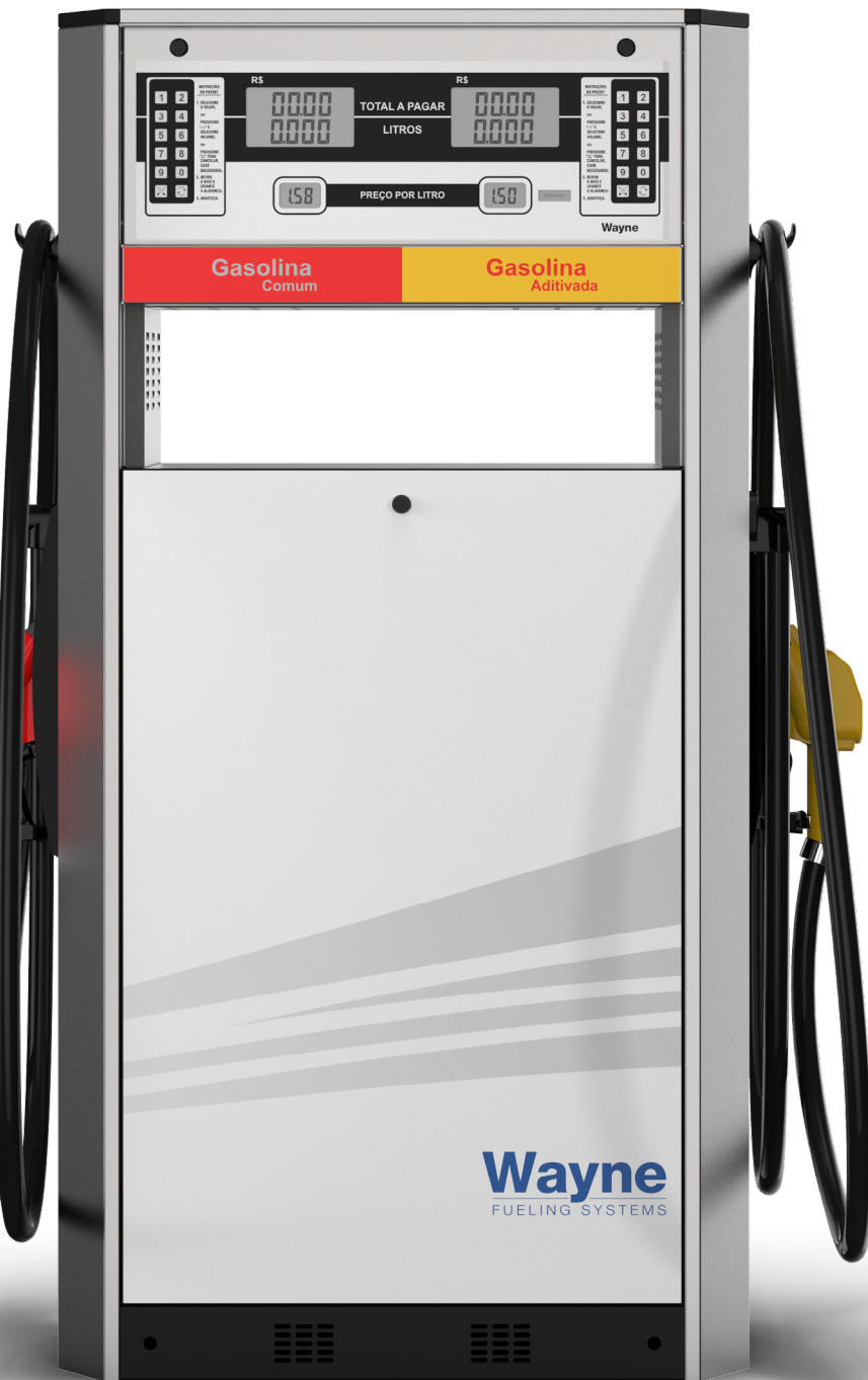
Bomba de Combustível Global Century™